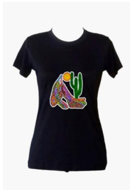
Babylook Abaporu Preta Código PCA021