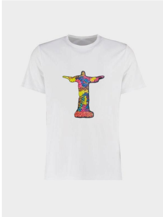
T-Shirt Cristo Código PCA022