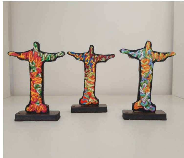
Escultura Cristo Pequena Código PCD026