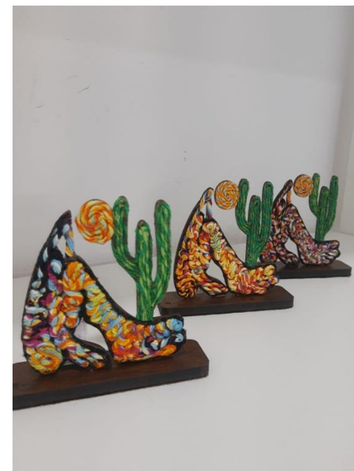
Escultura Abaporu Pequena Código PCD029