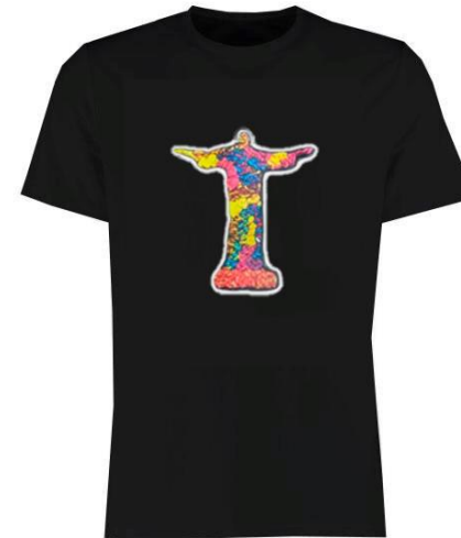
T-Shirt Cristo Código PCA022