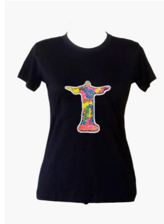
Babylook Cristo Preta Código PCA022