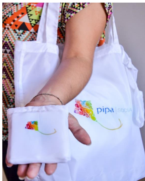
Ecobag Nylon Código PP553