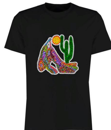
T-Shirt Abaporu Preta Código PCA021