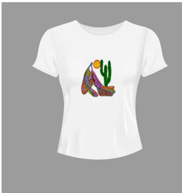
Babylook Abaporu Branca Código PCA021