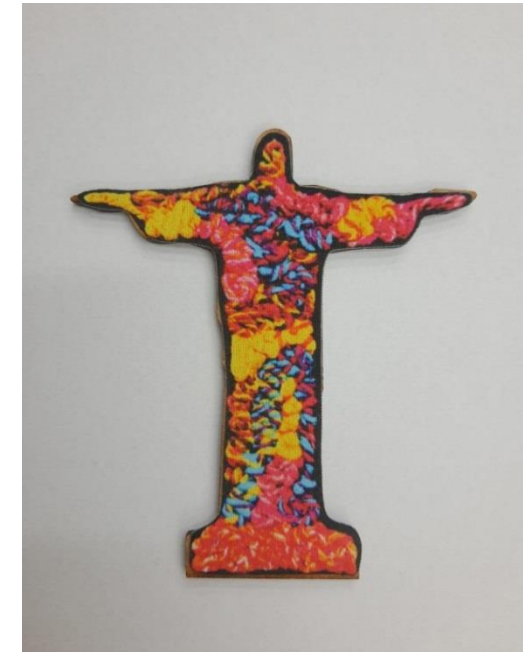
Ímã Cristo Código PCD030