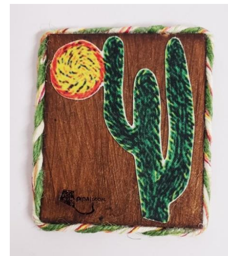
Íma Cacto Código PCD027