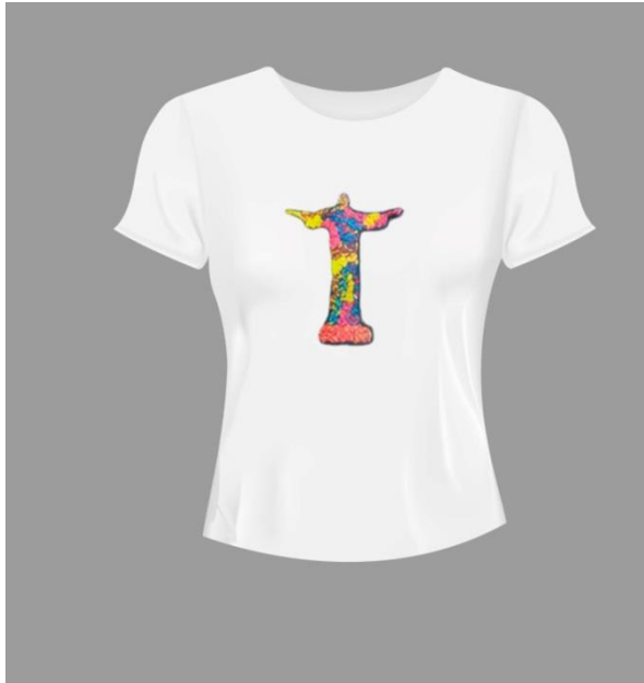
Babylook Cristo Branca Código PCA022