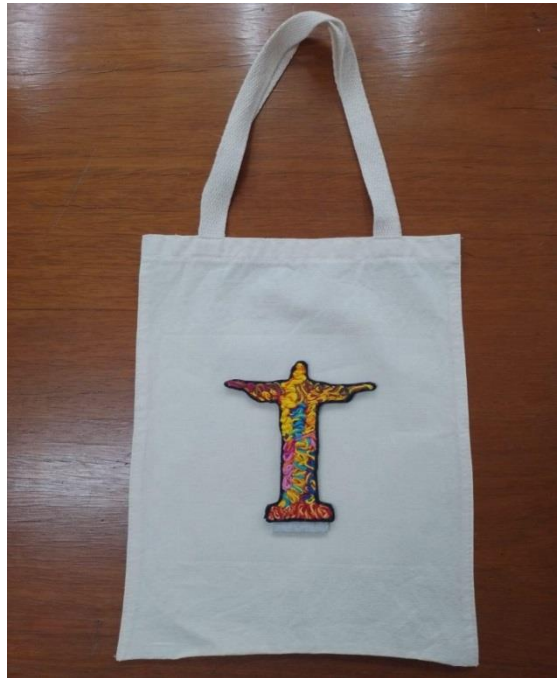
Ecobag Cristo Código PCA030