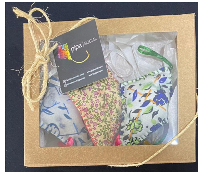
Kit Sachês Bolinhas e Pipa Código Pipa S1