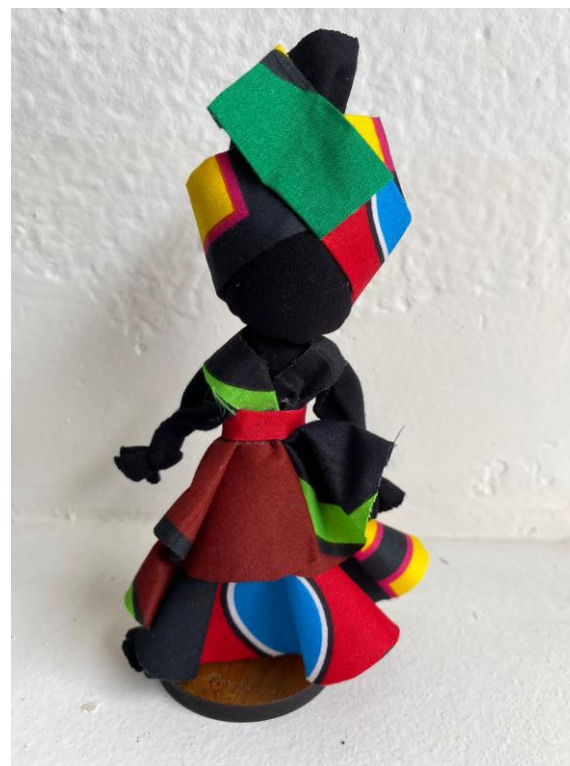
Boneca Abayomi Código AC004

Esta é a Abayomi (significa encontro precioso: abay=encontro e omi=precioso) Boneca de tecido negro, com nós, dobraduras e cortes.