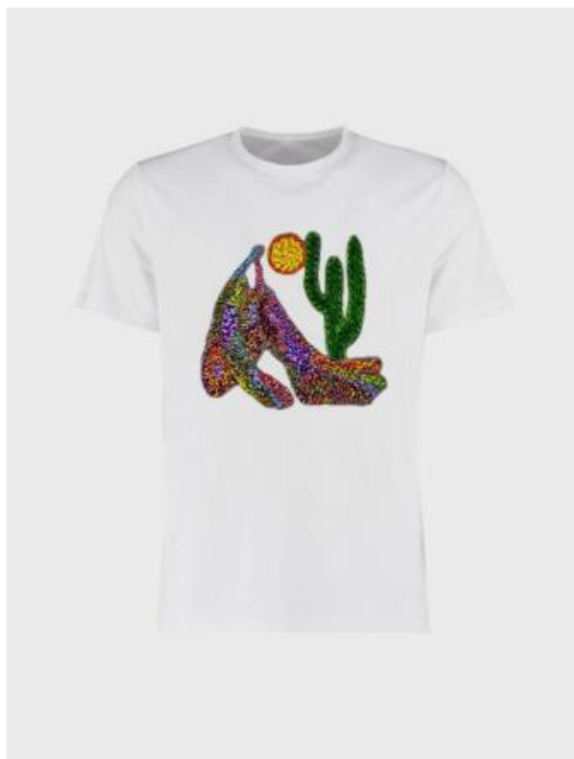
T-Shirt Abaporu Branca Código PCA021