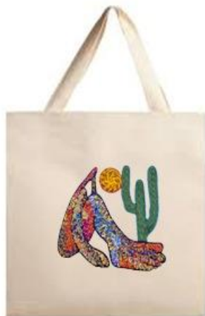
Ecobag Abaporu (Aplicação de Patch termocolante aveludado) Código PCA014