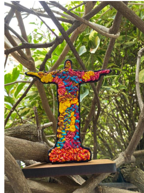
Escultura Cristo Grande Código PCD024