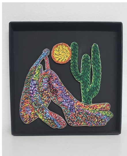
Quadrinho Abaporu Código PCD023