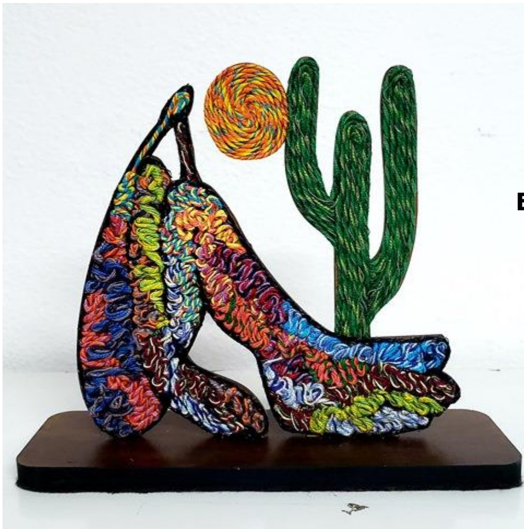
Escultura Abaporu Média Código PCD019