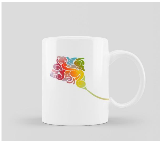
Caneca Código CAN 01