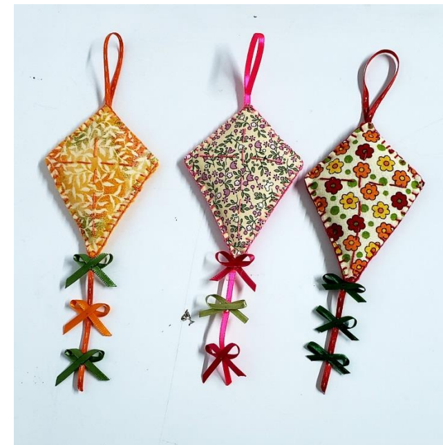
Ímã Pipa Código JD001